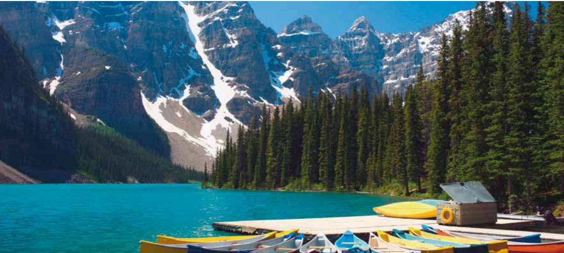
Moraine Lake im Banff Nationalpark

Der Facettenreichtum und die Kontraste dieses riesigen Landes erstaunen selbst Kenner immer wieder aufs Neue. Auf dieser Reise haben Sie genügend Zeit, Kanada mit allen Sinnen zu erleben, in einer neuen Umgebung richtig anzukommen und unterwegs die kleinen Dinge wahrzunehmen. Ihre Unterkünfte widerspiegeln die Kultur und Denkweise Ihres Gastgeberlandes – einmal traditionell und gehoben, einmal ausgefallen und modern, immer aber mit Charme und Komfort.