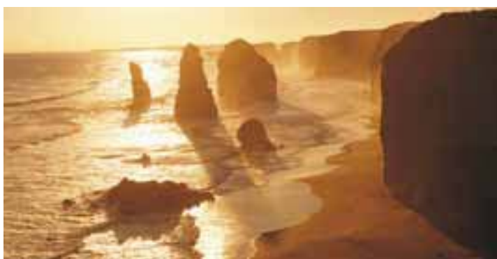
Twelve Apostles, Great Ocean Road

Freie Zeit bis zu Ihrem Transfer zum Flughafen. (F)