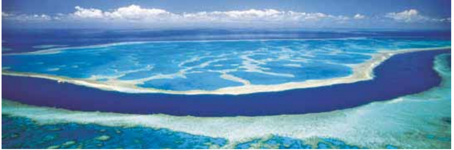
Great Barrier Reef

Auf dieser deutschsprachig geführten Reise erleben Sie ein Kaleidoskop australischer Sehenswürdigkeiten. Entlang der tropischen Queensland-Küste, vom «Top End», quer durch das Rote Herz des fünften Kontinents Richtung Weinbaugebiete, über die weltberühmte Great Ocean Road nach Sydney.